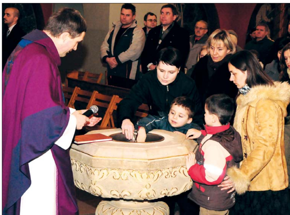
Fot. Jarosław Tomaszewski

języka greckiego zwana mistagogiczną), to katecheza, która przez znaki liturgiczne prowadzi do osobistego spotkania z Chrystusem we wspólnocie Kościoła. Wprowadza człowieka w tajemnicę Chrystusa Zbawiciela. Szczególnie Triduum Paschalne jest bogate w znaki liturgiczne. Na foto-