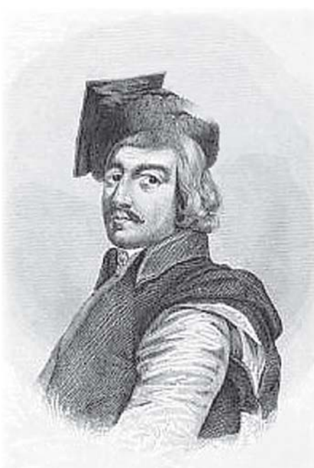
Jan Kiliński (1760 - 1819)