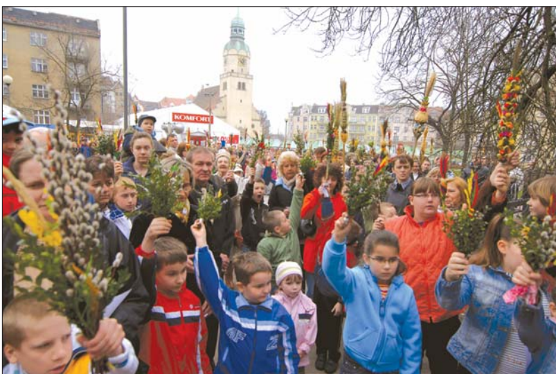
Niedziela Męki Pańskiej – początek procesji z palmami