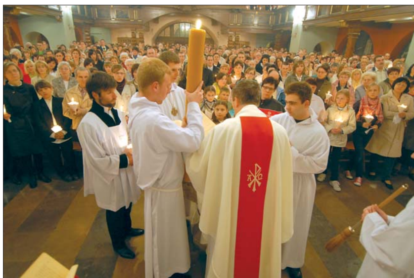
Wigilia Paschalna – odnowienie przyrzeczeń chrztu świętego