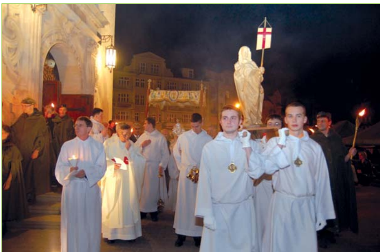
Wigilia Paschalna – procesja rezurekcyjna

Wielka Sobota, przed nami Msza Święta Wigilii Paschalnej w Noc Zmartwychwstania. Jest ciepły, bezwietrzny wieczór. Pod kościołem Maryi Królowej, który tonie w ciemności stoją uprzejme harcerki i wręczają mi świecę oraz teksty pieśni.