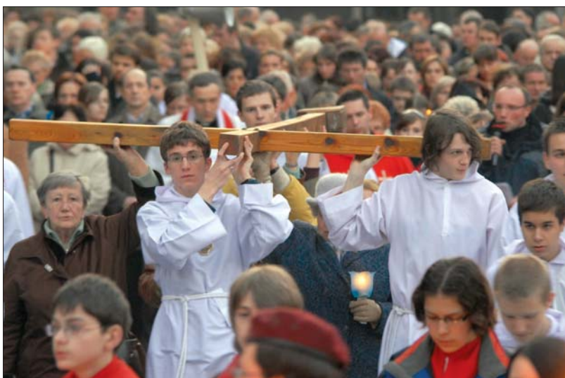
Droga krzyżowa ulicami parafii