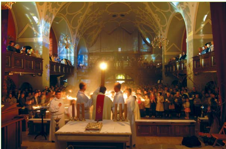
Wigilia Paschalna – światło z paschału przekazywane wiernym