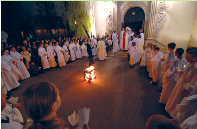
Wigilia Paschalna – poświęcenie ognia

W czasie Wigilii Paschalnej słowo Boże czytała nasza parafianka, żona, matka, zawodowa aktorka.