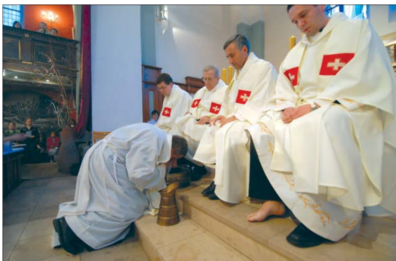
Wielki Czwartek – umywanie nóg