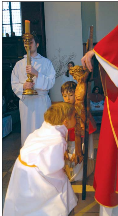
Wielki Piątek – adoracja krzyża