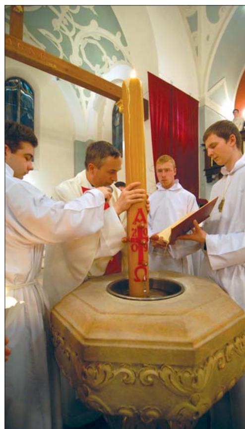
Wigilia Paschalna – poświęcenie wody