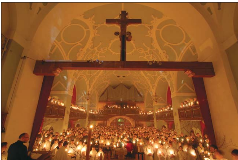
Wigilia Paschalna – liturgia słowa