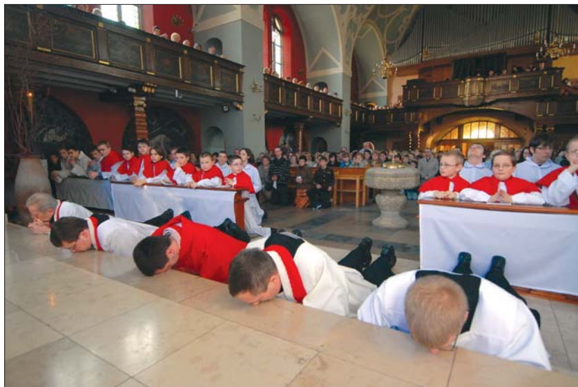
Wielki Piątek – początek liturgii