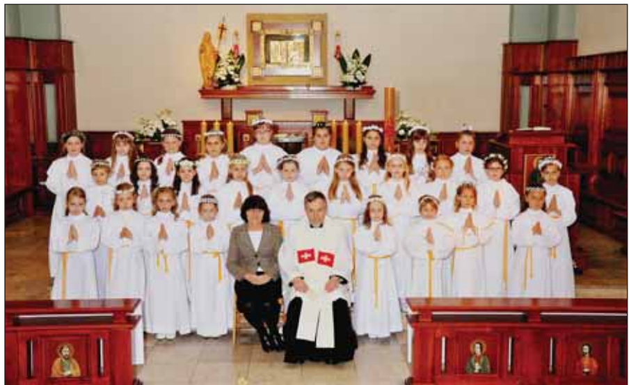
Dziewczyny, które przyjęły Pana Jezusa 17 i 18 maja