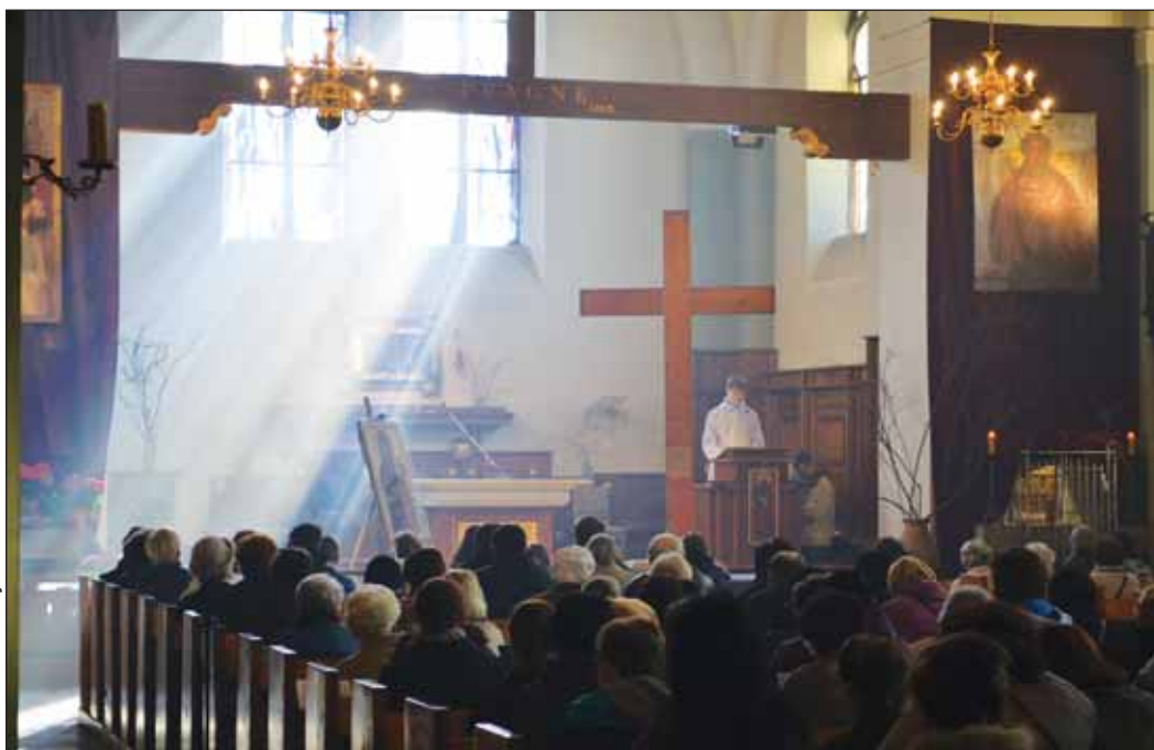
Modlitwa przy Krzyżu i Ikonie w naszym kościele w Wielki Piątek 18 kwietnia