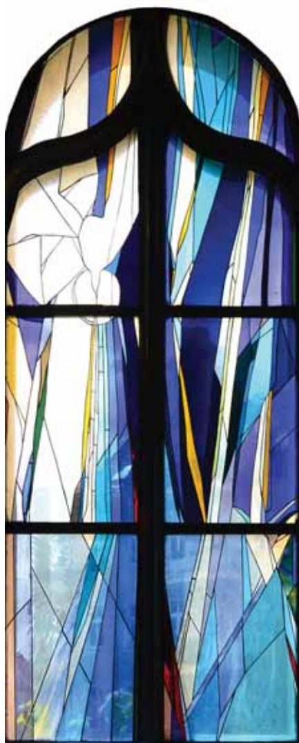
Duch Święty – boczny witraż w prezbiterium naszego kościoła