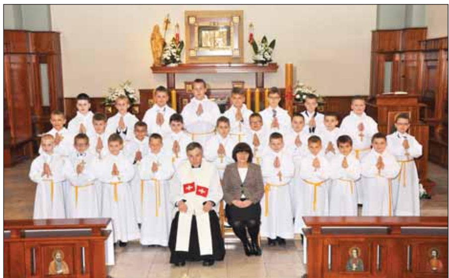
Chłopcy, którzy przyjęli Komunię Świętą 17 i 18 maja