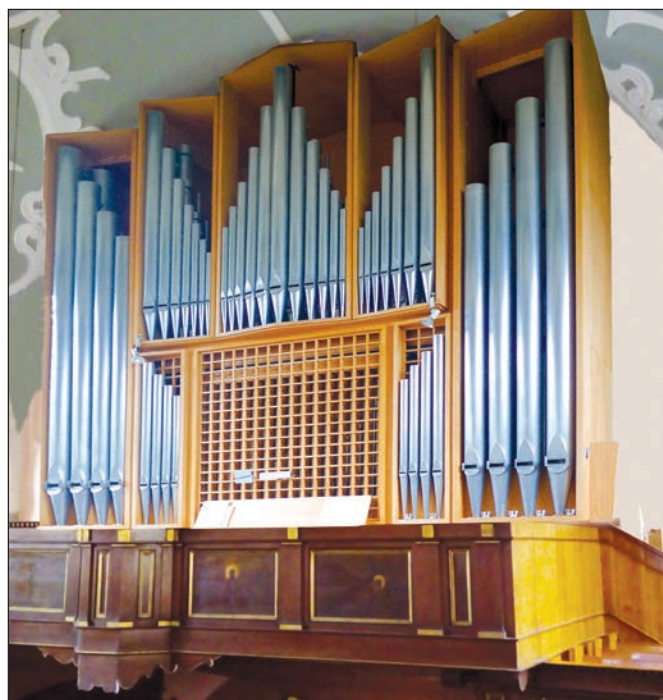
Tak będzie wyglądał nowy instrument w naszym kościele