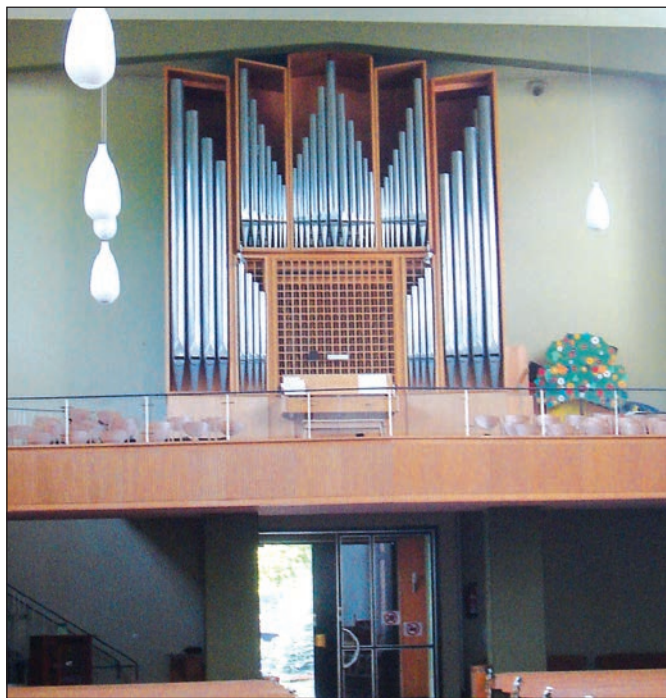
Widok na balkon kościoła w Neunkirchen. Niebawem ten kościół będzie rozebrany